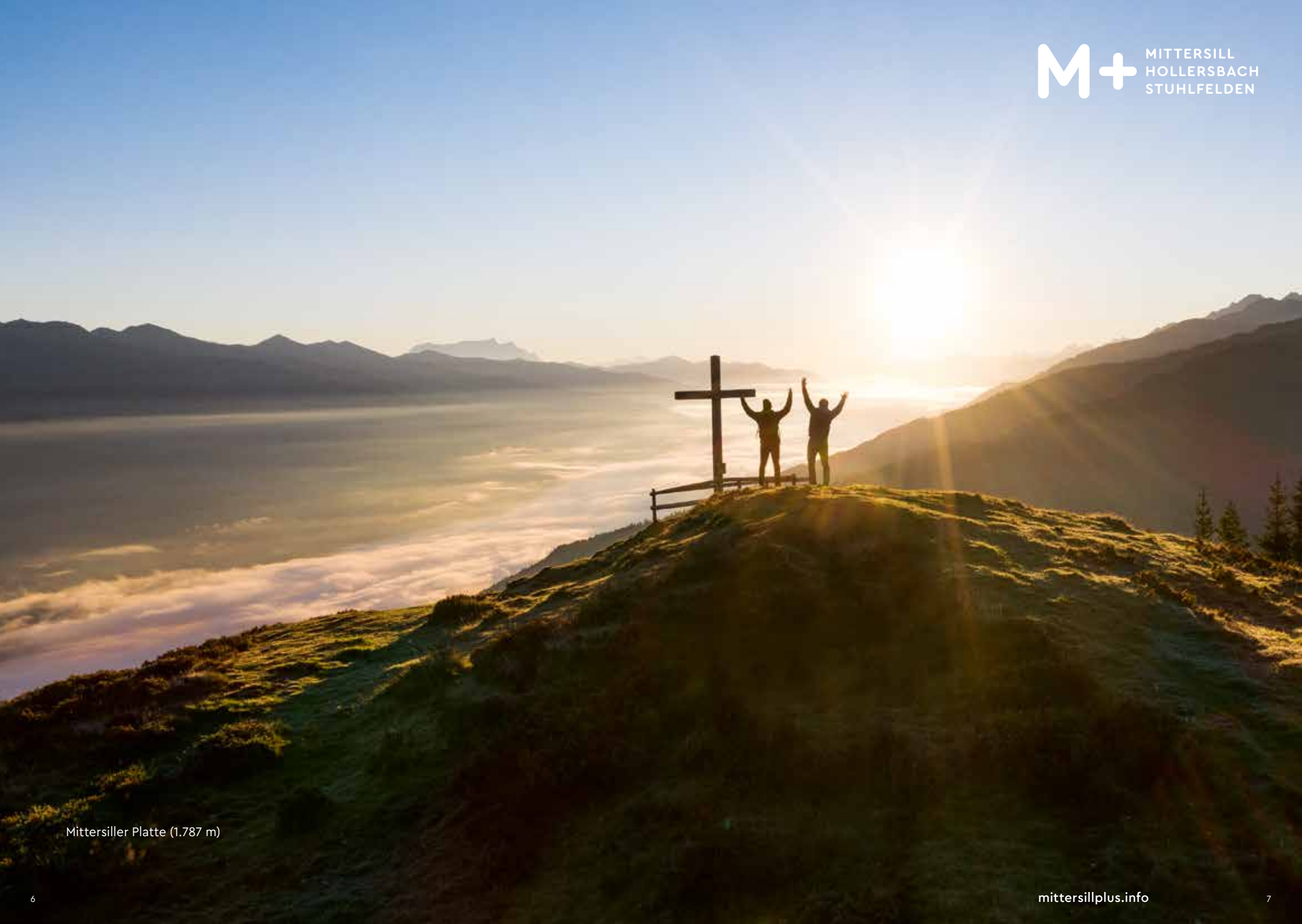
Mittersiller Platte (1.787 m)